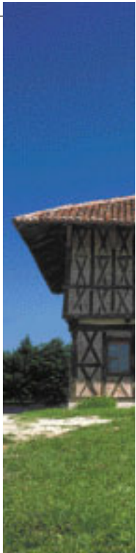
Un paysage : pourquoi pas la Bresse et le Manoir de la Charme à Montrevel ? C'est très beau.